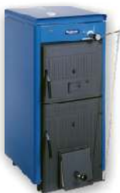
Logano G211 na voljo v 5 velikostih